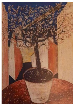
«La cementificazione e lo scontro tra uomo e natura», olio, 1959

E' una deflagrazione fuori d'ogni controllo e d'ogni descrizione, di puro senso negativo, fredda come il gelo più vuoto eppure gonfia di crudeltà ribollente e di fiamme tossiche mostruose.