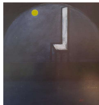
«Nel dialogo con l'universo manca la persona umana», tempera, 1975

Pur relegata in un vaso, la pianta non si arrende alla prepotenza dell'uomo, e rabbiosa e indomita «esplode» dintorno la sua fioritura, come semi di speranza.